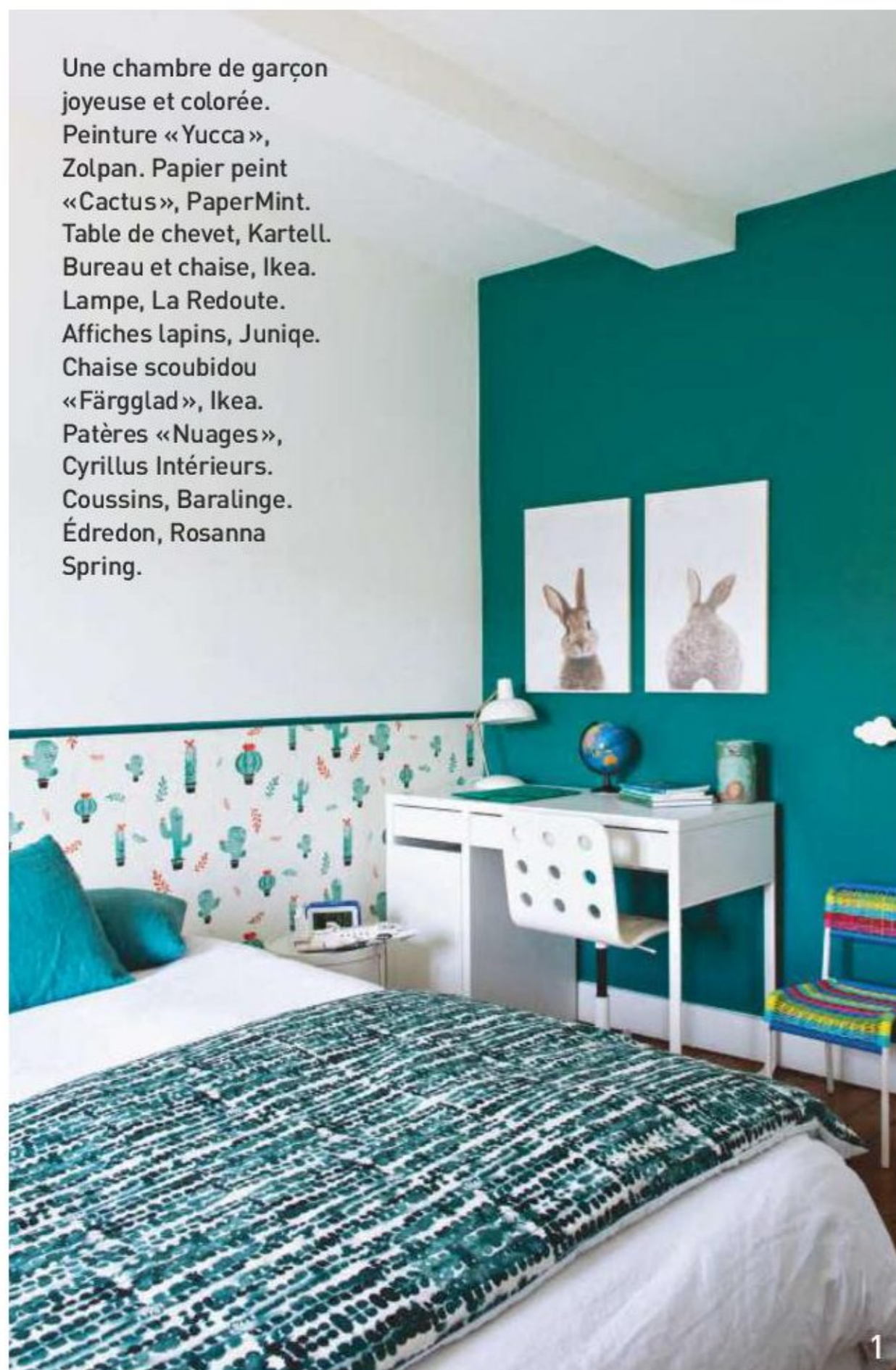
Une chambre de garçon joyeuse et colorée. Peinture «Yucca», Zolpan. Papier peint «Cactus», PaperMint. Table de chevet, Kartell. Bureau et chaise, Ikea. Lampe, La Redoute. Affiches lapins, Junique. Chaise scoubidou «Färgglad», Ikea. Patères «Nuages», Cyrillus Intérieurs. Coussins, Baralinge. Édredon, Rosanna Spring.